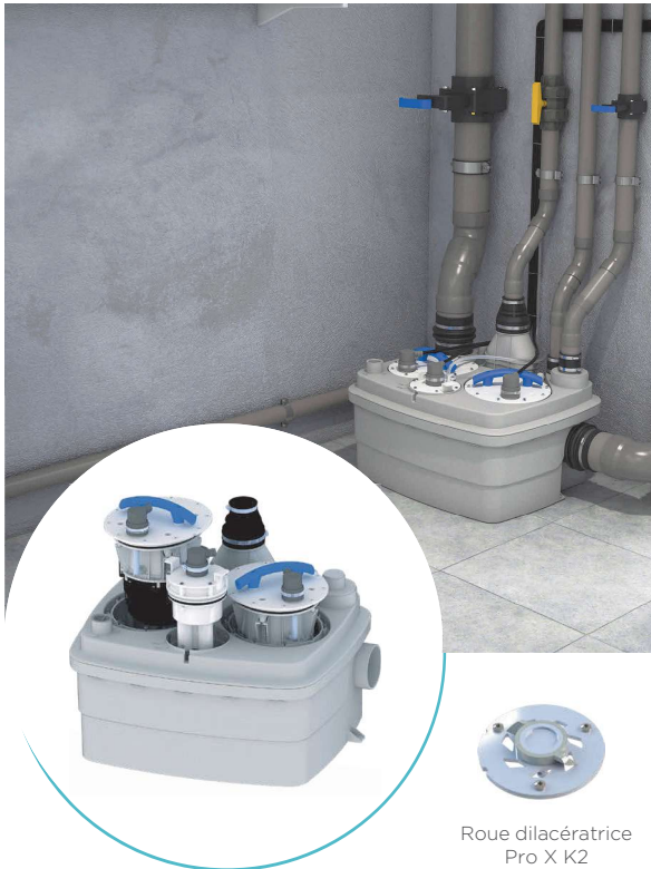
Roue dilacératrice Pro X K2

Sanicubic 2 Classic L est une station à 2 pompes conçue pour le relevage des eaux usées de maisons individuelles. Elle bénéficie de la technologie de dilacération Pro X K2 permettant l'évacuation des effluents par un tuyau de faible diamètre (50 mm ext.). Sanicubic 2 Classic L est idéale pour un usage intensif, ses deux moteurs fonctionnent de façon alternative en toutes circonstances. La station est livrée de série avec un coffret de commande intégrant une alarme sonore et visuelle. Une alarme filaire de 5 m permettant une surveillance de votre station depuis une autre pièce est disponible en option.